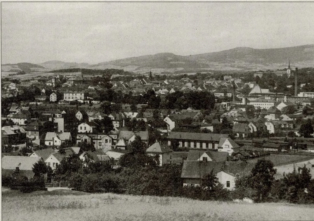
Böhmissch Leipa, ursprünglich eine kleine Siedlung im Besitz der Herren von Lípa, erhielt 1381 Stadtrechte. Die Stadt gehörte wechselnden Besitzern; von 1634 bis 1848 war sie im Besitz der Familie Kaunitz. 1850 wurde Böhmissch Leipa zur Bezirksstadt und zu einem Eisenbahnknotenpunkt. Am 1. Dezember 1930 hatte Böhmissch Leipa 13.714 Einwohner, am 17. Mai 1939 waren es 12.000 und am 22. Mai 1947 11.991. Viele sogenannte „Repatrianten“ und Roma siedelten sich in der Nachkriegszeit an.