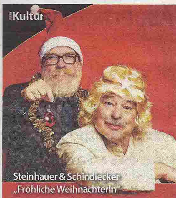
Steinhauer & Schindlcker „Fröhliche Weihnachterln“