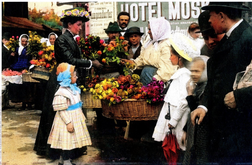
Gute, alte Zeit: Nur Namen und Daten sind den meisten Familienforschern zu wenig. Die neue Datenbank soll wichtige Zusatzinformationen und Anknüpfungspunkte bieten

Wer profitiert nun von so einer Datenbank? Vor allem Ahnenforscher – private und professionelle. „Die Datenbank liefert unzählige Anknüpfungspunkte, wo weiter-