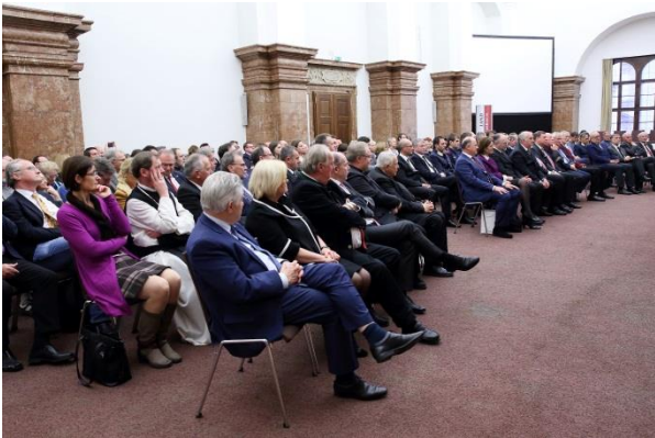
Foto Nr. 21: Blick in den Saal, im Vordergrund Altlandeshauptmann Dr. Josef Pühringer

Nach dem Ende des offiziellen Teiles gab es Fototermine des Herrn Landeshauptmanns mit jedem einzelnen der Ausgezeichneten und auch mit dessen Familie.