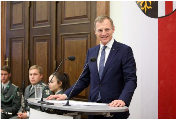
Foto Nr. 20: Landeshauptmann Mag. Thomas Stelzer bei seiner Ansprache